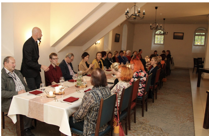
Pidulik õhtusöök Mooste mõisa viinakögis

katsuda ja osta. ☺ Teel kõrvalmajas asuvasse Villakotta kohtusime järgmise kassiga – see karvane nunnukas küsis ise paisid, aga miskipärast ei soovitud teda nii palju silutada kui teatrikassi.