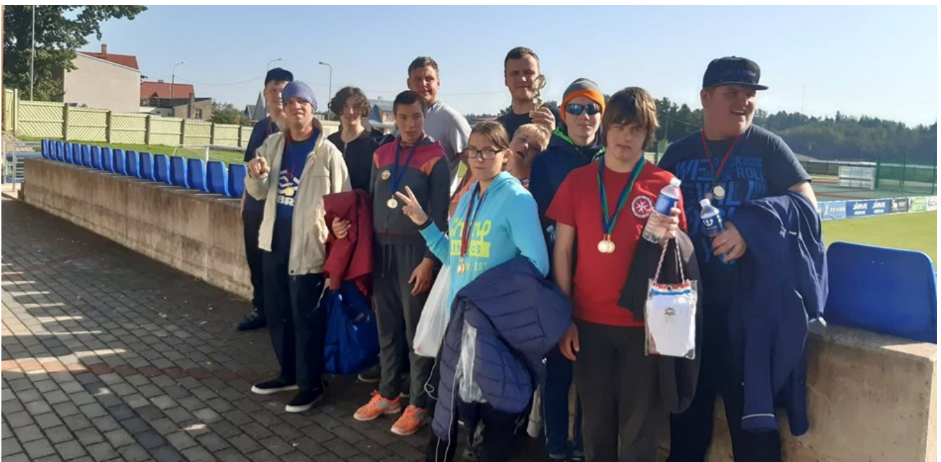
Räpina Aianduskooli Maarja Küla sportlased koos Maarja Kooli sportlastega