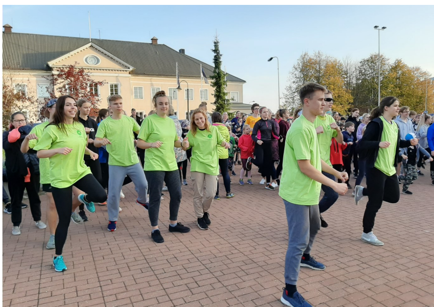
... ja jalgadele enne starti