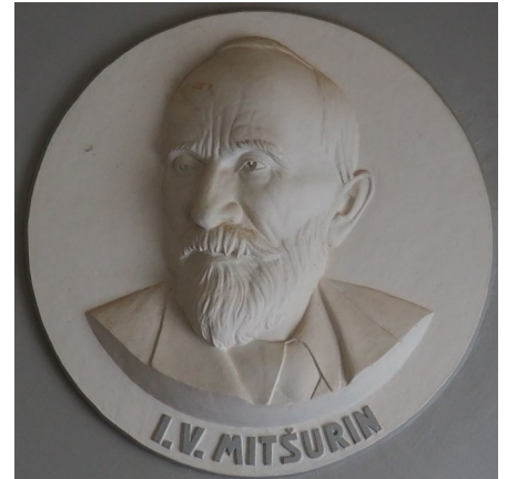
Ivan Mitšurini bareljeef mõisahoones

Mitšurini nime alusetult seostatud Trofim Lõssenko õpetusega, nimetades seda mitšuurinlikuks agrobioloogiks. Kahjuks tuntaksegi Mitšurinit peamiselt tema poolt kirja pandud ja hiljem kurikuulsaks loosungiks muutunud lause tõttu: „Meie ei või oodata looduselt armuande, meie ülesandeks on neid temalt võtta.“. Harvemini tsiteeritakse tema teist lauset: „Sort otsustab kõik!“. Objektivse hinnangu andmiseks Ivan Mitšurini elutööle peaks tutvuma tema kirjaliku pärandiga. Eesti keeles ilmunud I. V. Mitšurini „Valitud teosed“ (1949) sisaldavad tema aretatud taimede kirjeldusi ja esimese maailmasõja eel ilmunud artikleidki.