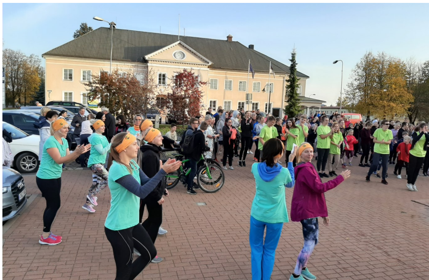
Soojendusharjutused kätele ...