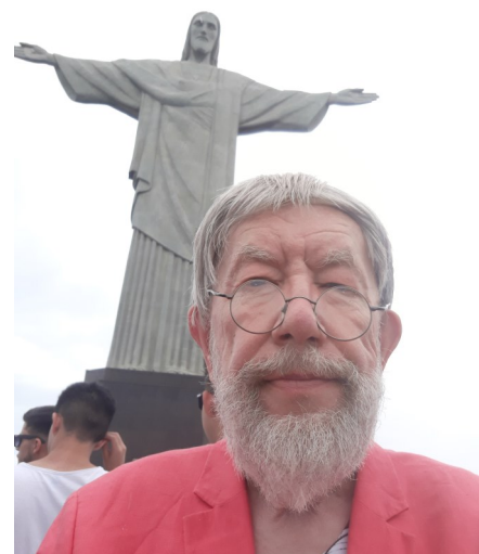
Toivo ja Kristus

saima loodusliku asukohaga miljoni linn. Sealsed inimesed naudivad elu täiel rinnal – tantsuline muusika, kerged jahutavad kokteilid, maitsvad ja odavad toidud, mitmekülgsed spordialad ja kindlasti muinasjutulised liivarannad, kus kuuma päikese käes energiat koguda ning lõõgastuda. Linn on tuntud muuhulgas karnevalide, Copacabana ja Ipanema supelrandade, Suhkrupeamäe ja 39,6 m kõrguse Lunastaja Kristuse kuu poolest, mida on näha pealinna igast kohast.