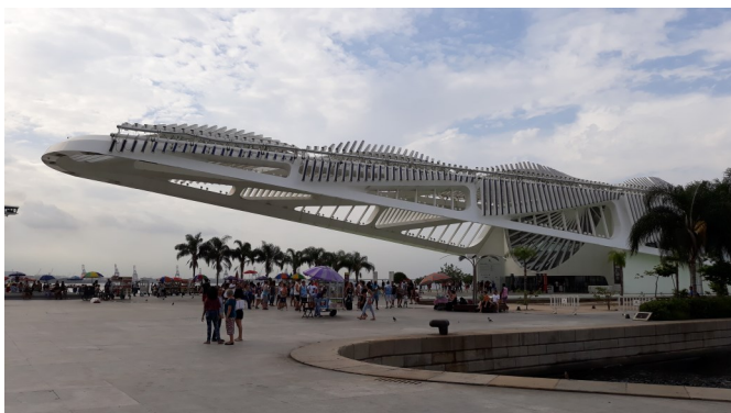
Kaubasadam ja uus meremuseumi hoone