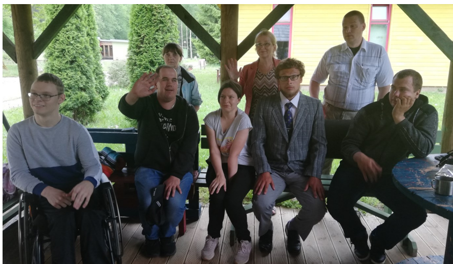
Lõpetajad Maarja külas

lõpuaktus. Kõik seitse lõpetajat tahavad jätkata sügisel õpinguid. Valituks osutuvad kolm HEV kutseõpet pakkuvat kooli: Valgamaa Kutseõppekeskus,