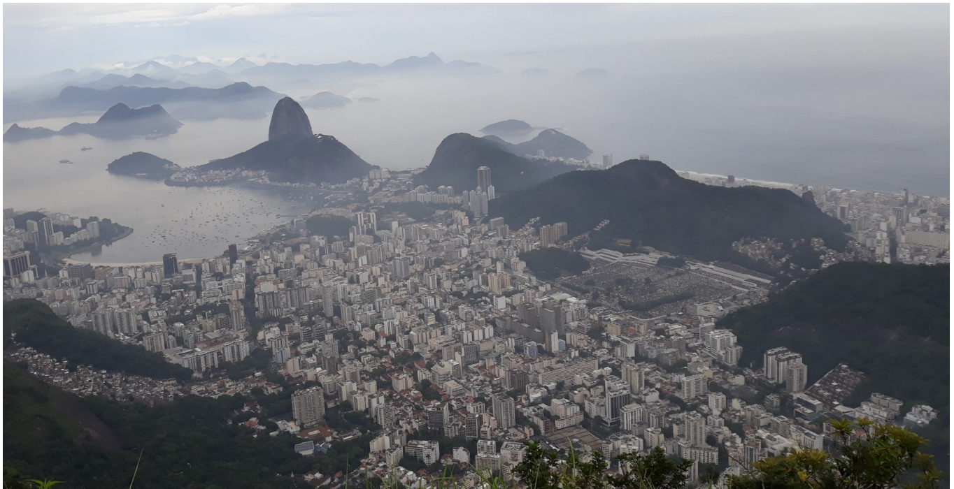
Varahommikune vaade Kristuse jalamilt Suhkrumäele ja Iponema linnaosale

Mitte sellepärast, et see ei maitsenud, vaid ma ei jõudnud seda lihtsalt ära süüa. Kuus eurot maksnud praad sisaldas poolekilost maitsvat ja mahlast nõretavat veiseliha, millele lisandus kaks praemuna, suur kuhi hautatud aedvilju, seeni ja praekartuleid ... Seda hiigelportsu ei aidanud alla loputada ka igati kvaliteetne õlu, mille üks pint maksis vaid ühe euro ringis. Edaspidi olin söögikohtades ettevaatlikum ja sageli tellisime terve prae kahe-kolme peale.