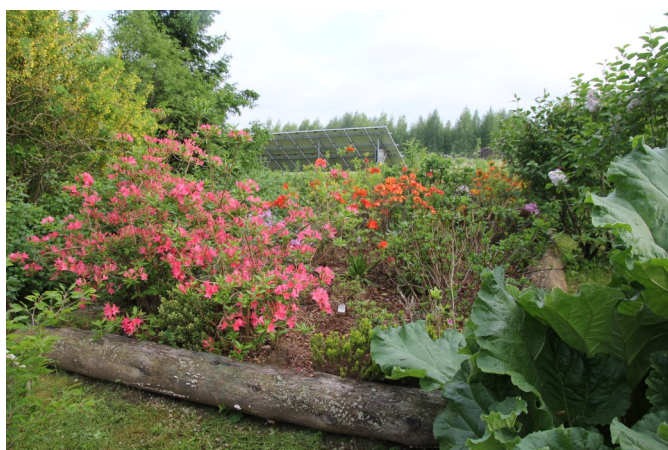
Värvilised rododendronid, taamal päikesejaam