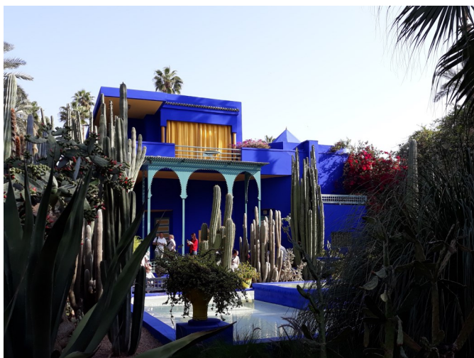
Kubistlikus stiilis stuudio