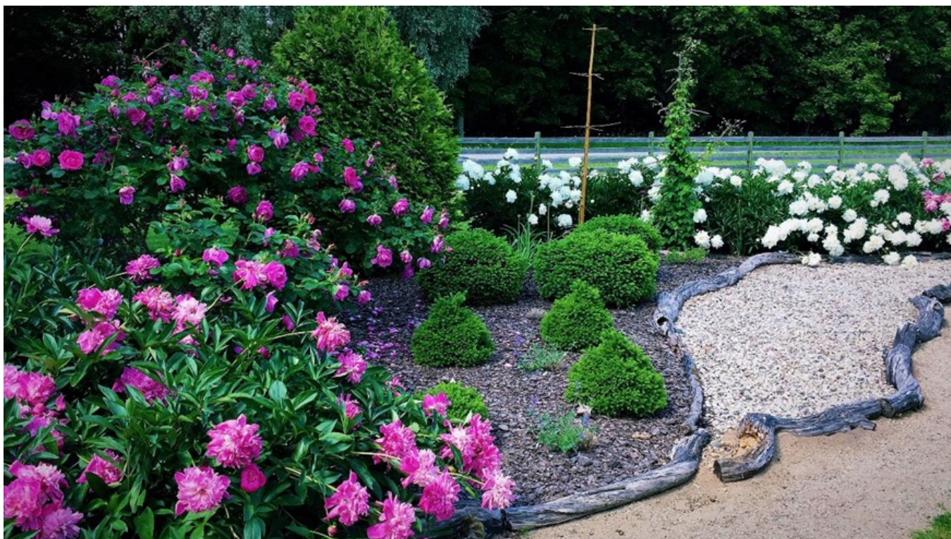
Uibu talu pojengide ja okaspuude peenar, silmapaistva peenraäärisega