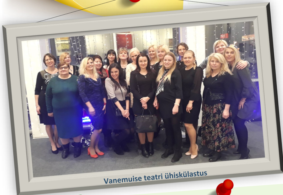
Vanemuse teatri ühiskülustus

Aitäh kõigile õpetajatele, kes panustasid meie haridus-tee täiustamisele, me tegelikult ju teame, et andsite endast parima. Ausõna – meie ka.