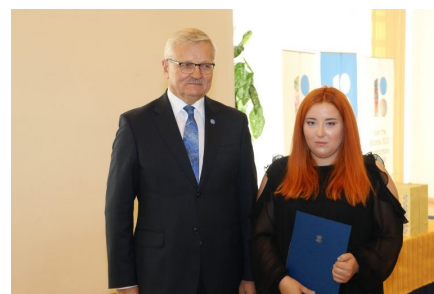
Minister Tarmo Tamm ja Häly Raidla