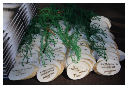
Sõprus on mängus – I koht!

sehitus ja söök. Alati on võimalus ise oma aeg meeldivaks muuta, tähtsad on sind ümbritsevad inimesed.