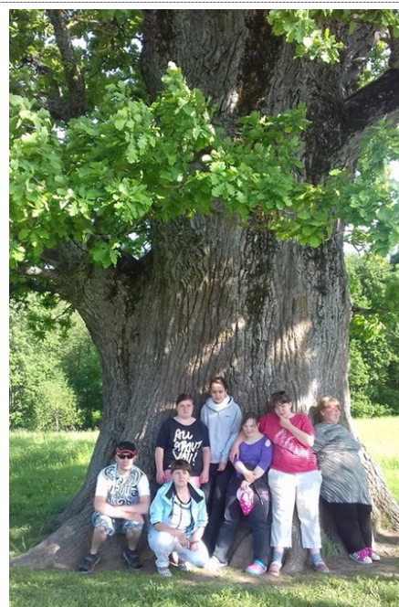
Õpilased Tamme-Lauri tamme all