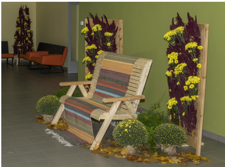
Lõpetavate erialade ühistöö: aednikud kasvasid lilled, floristid tegid seaded, maastikuehitajad meisterdasid pingi ja tekstiilkäsitöö kaunistas vaibaga

tulid ka eksamil tuttavad ette, kuigi eksamihommikul tundus võilillgi võõras, ja õiged töövõtted praktises osas olid käe sees nagu iseenesest.