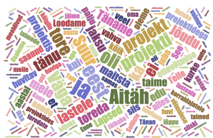
Joonis 1. Sõnapilv osalejate tagasisidest ja kommentaaridest projekti kohta.

Toimus ka juba traditsiooniks saanud e-viktoriin „Nädala küsimus“, kus projektis osalejatel tuli iga nädal vastata ühele temaatilisele küsimusele. Samuti oli võimalik kaasa lüüa loomingu- ja