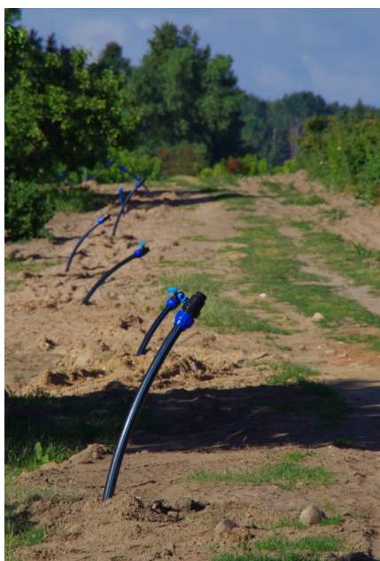
Kastmissüsteemide väljavõtete rida