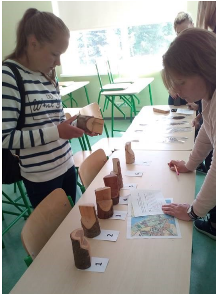
Metsanduslase ülesande lahendamine