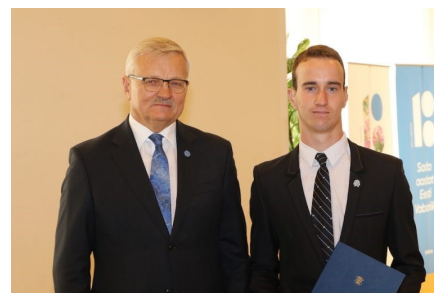
Minister Tarmo Tamm ja Jaano Oras

Angelika Lebedev, Eesti Maaeluministeerium