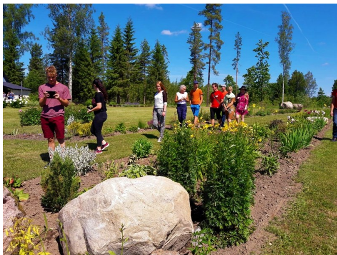
Liblikaaias tiivulisi otsimas