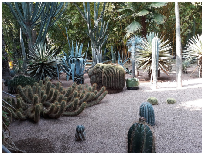
Kaktused igas mõõdus