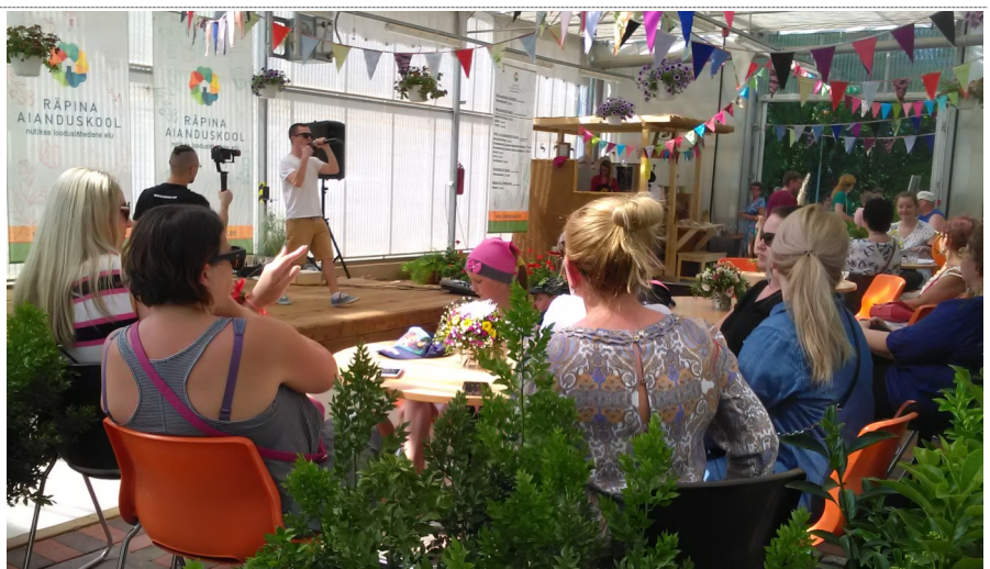
Kohviku külastajad nautimas aianduskooli uut promolugu „Näpud mulda“

Meie kohviku tegi eriti toredaks see, et kohvik sündis erialade õpilaste/õpetajate/töötajate koostöönä. Väga paljud andsid oma panuse ja tulemus oli muljetavaldav. Siinkohal ei hakka