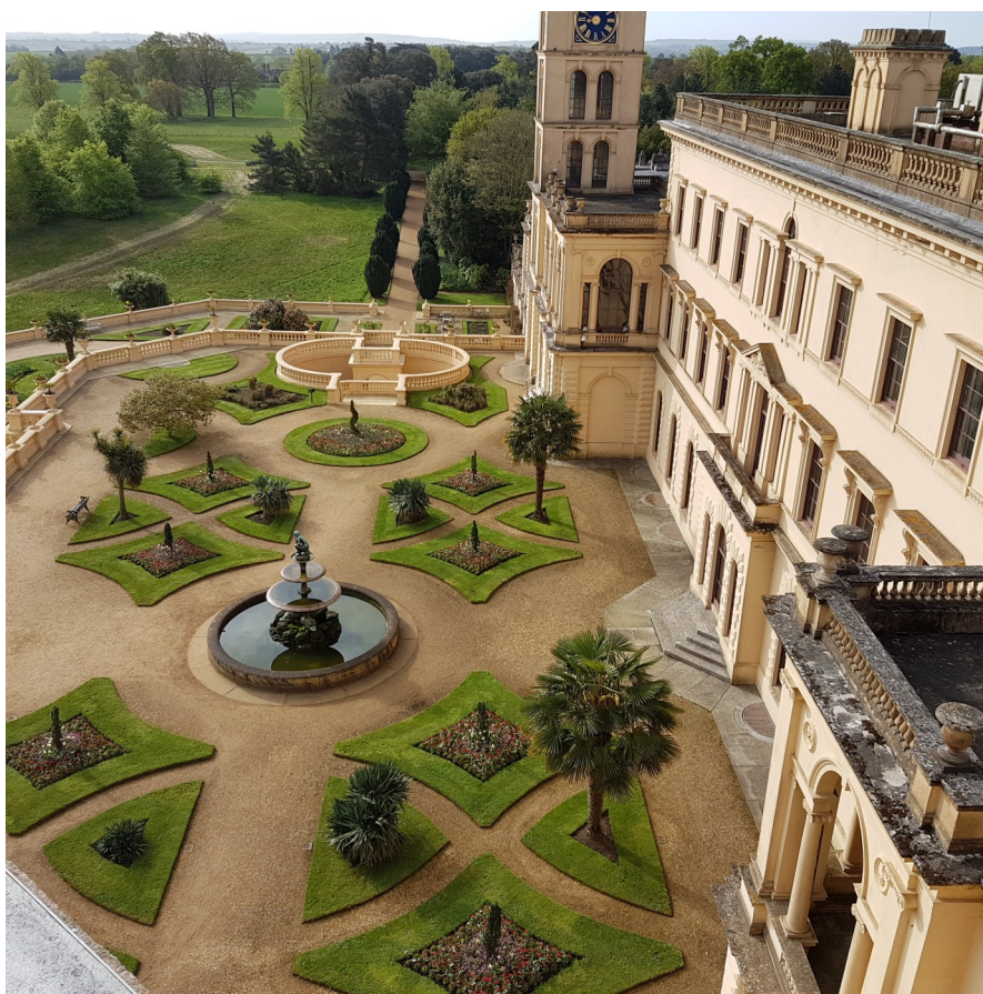
Ülemine terrass pärast sibullillede eemaldamist