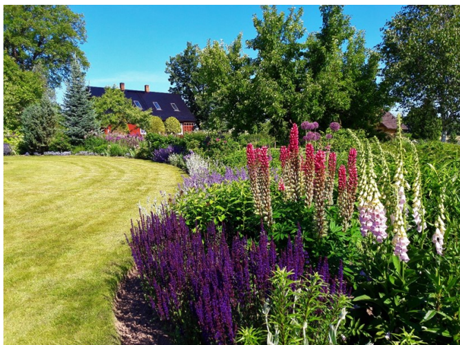
Imeline vaade Palusalu aias