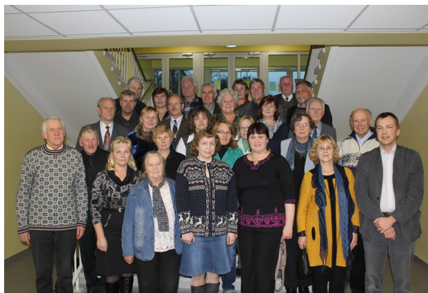
Vilistlaskogu 08.11.2012.

Räpina Aianduskooli Vilistlaskogu tuleb taas kokku aasta pä- rast.